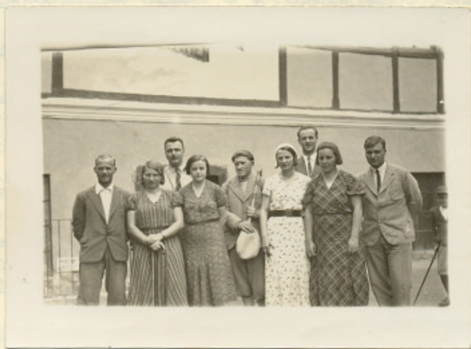
Učiteľský zbor na výlete vo Slabinec 24. VII. 1933